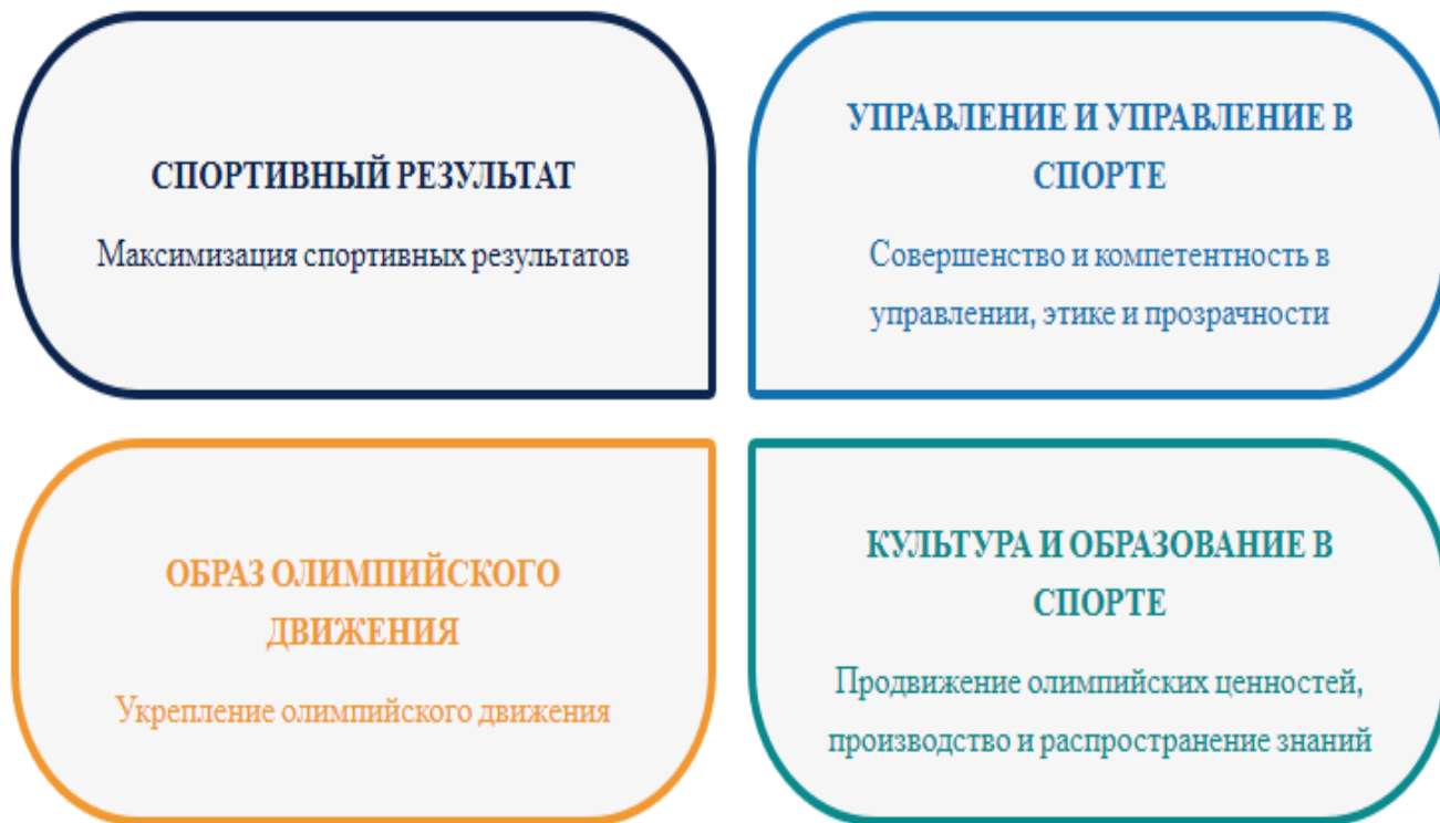
Рисунок 2 – Приоритетные направления деятельности Олимпийского комитета Бразилии

На рисунке 2 представлены приоритетные направления деятельности Олимпийского комитета Бразилии.